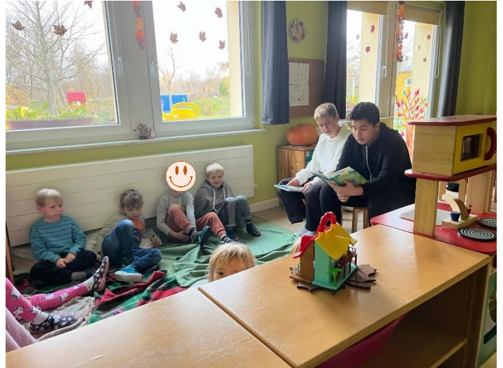
Die 8. Klasse beim Vorlesen in der Grundschule

Mit einem Stapel ausgewählter Kinderbücher in der Hand zogen die Achtklässler in die Klassenzimmer der Grundschul Kinder im Haus II ein. Sie lasen ihnen Geschichten vor, die Spannung, Abenteuer und Freundschaft versprachen. Die Grundschul Kinder lauschten gebannt und waren von der Präsentation der älteren Schülerinnen und Schüler begeistert.